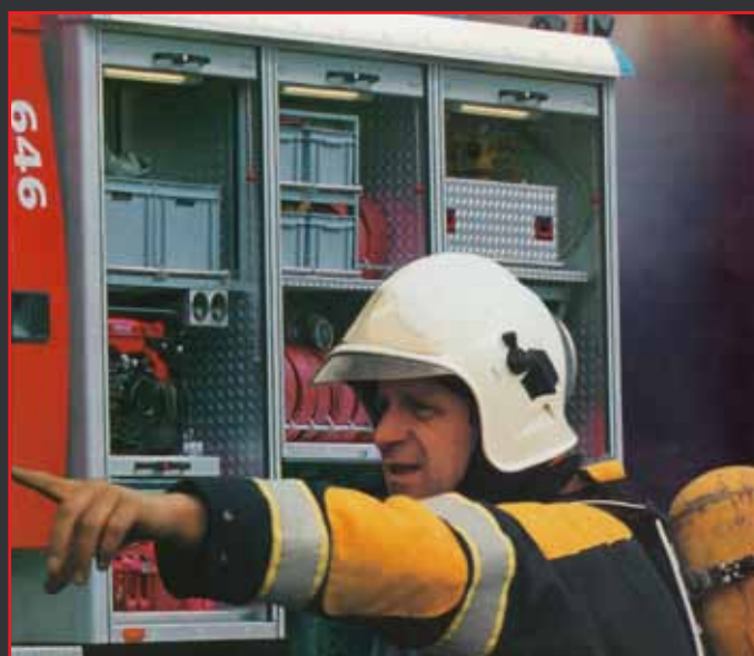
Armazenamento de material nas viaturas de socorro