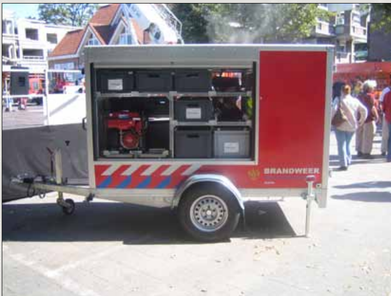
Nos reboques há sempre espaço para as caixas.

Em vários veículos podemos encontrar as caixas denominadas "caixas de ataque". Nessas caixas podemos encontrar o material necessário para uma intervenção. Aqui um exemplo de um carro do Força Aérea Real Holandesa.