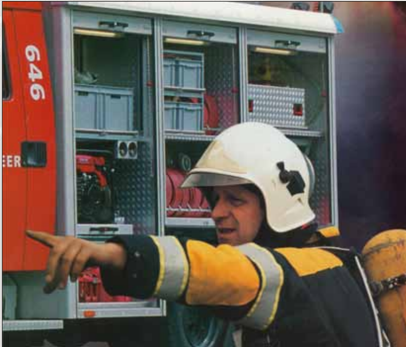
Em cada veículo de incêndios são utilizadas caixas em plástico

Antigamente tínhamos que adaptar as caixas ao espaço disponível nos veículos (diminuir cortando ou alongando por soldagem). Actualmente as construtoras adaptam os veículos e a adaptação das caixas já não é necessária.