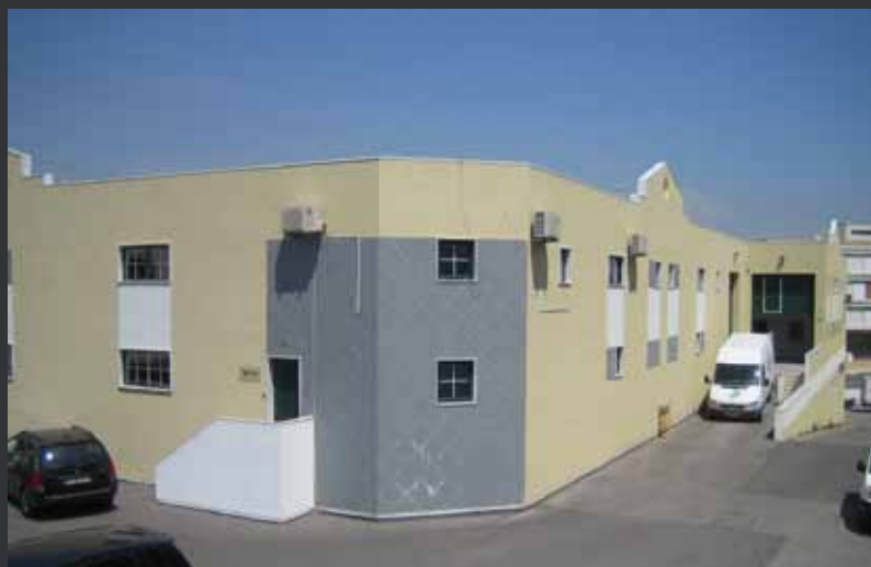
Prior Velho, Portugal

O nosso sortido responde a todas as perguntas relativamente a caixas de armazém e de transporte, embalagens reutilizáveis, paletes e caixas-paletes, bacias de retenção, caixas certificadas para o transporte seguro de materiais perigosos, contentores de lixo, contentores para a recolha selectiva de resíduos