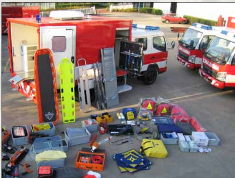
Conteúdo de um contentor de socorro para transporte aéreo

Através da uniformidade do equipamento, o pessoal de cada corporação pode facilmente encontrar o equipamento nos contentores de outra corporação. Em pleno combate à calamidade o stress é inevitável. Felizmente não se perde mais tempo à procura do material necessário e há mais concentração para a execução da tarefa, o que é mais importante.